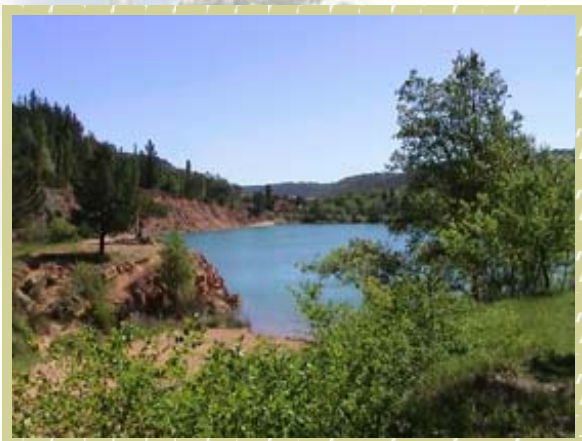
Un paysage typique de Kablumy

A Kablumy, il est indispensable d'avoir son appareil photo en permanence. En effet, Kablumy offre des paysages hors du commun. Montagne, lacs, champs, oliviers... Attention les yeux ! Voici Kablumy ! Le maire de Kablumy soutient René Souchon candidat aux élections régionales Auvergne